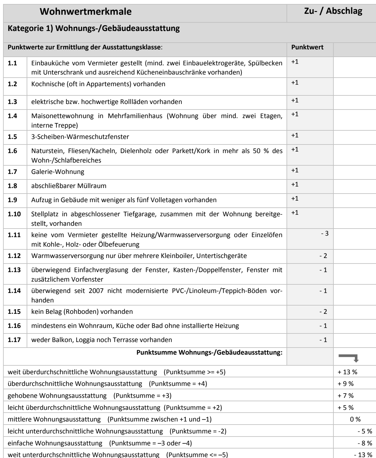
Tabelle 2: Weitere Wohnwertmerkmale, die den Mietpreis signifikant beeinflussen